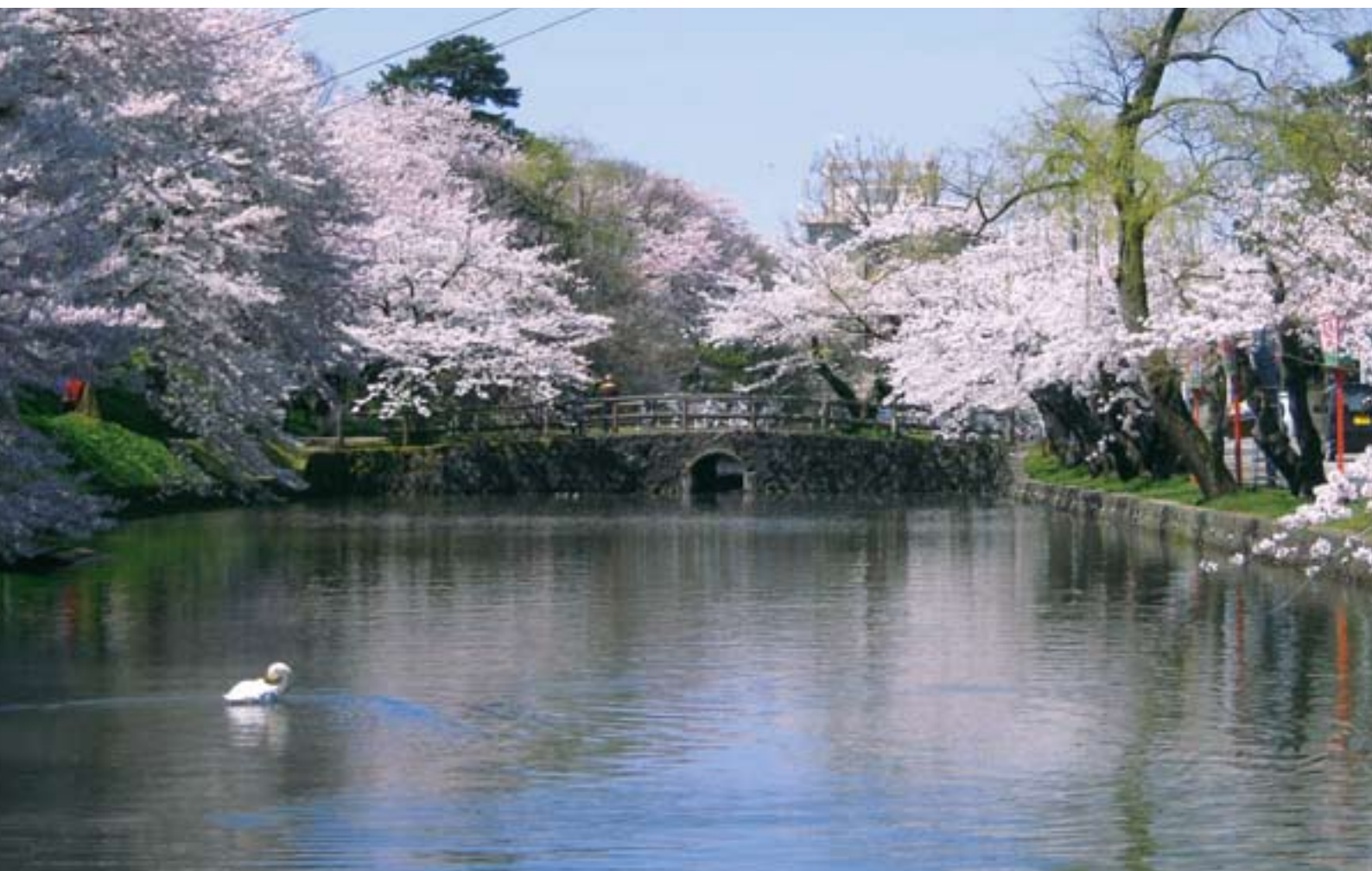
鶴岡公園のお堀と桜並木

URL http://www.shonaiakagawa.jp e-mail info@shonaiakagawa.jp