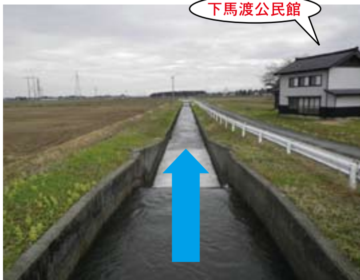
東3号幹線用水路工事予定区間 下馬渡公民館周辺から 下流側へ約1kmの区間

つきましては、地元関係者の皆様には、工事の内容等について説明して参りますので、ご理解とご協力をお願い申し上げます。