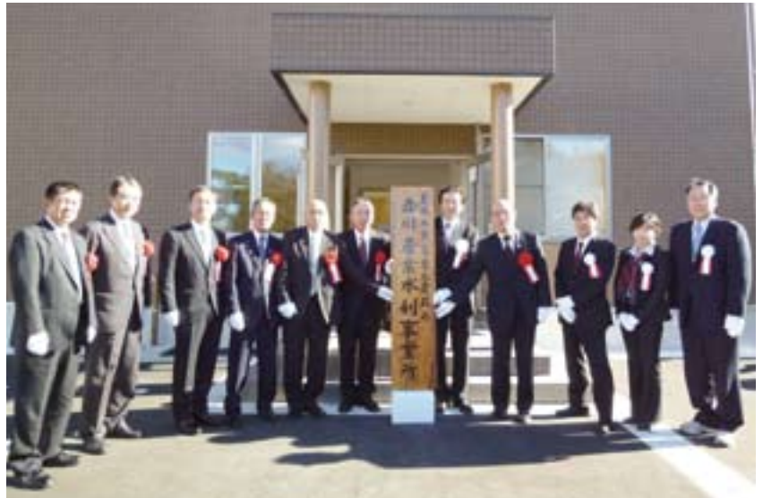
Photo : 平成22年11月19日 赤川農業水利事業所開所式

事業所では、今後8年間の予定で実施される、国営赤川二期事業における、調査・設計・工事施工にかかる業務を行うとともに、関係改良区及び関係機関との調整など、事業の地元窓口として、事業完了までお世話になることとなります。